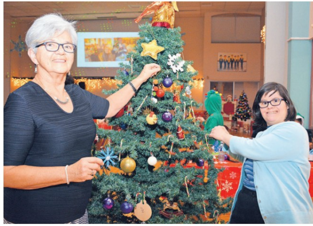
Les bénévoles rencontreront les filleuls ainsi que les membres de l'équipe du Parrainage civique.

Cette année, la Fondation Bon Départ soutient l'événement grâce à un don de 3000 $ qui permettra au Parrainage civique du Haut-Richelieu de remettre un petit présent à chacun de ses membres, en plus d'offrir une animation enlevante pendant la soirée de danse.